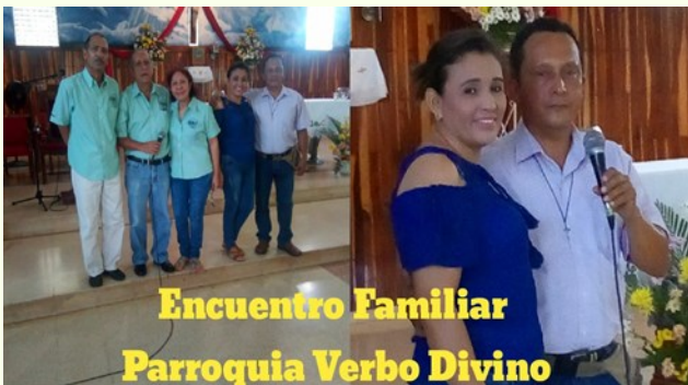
Encuentro Familiar Parroquia Verbo Divino