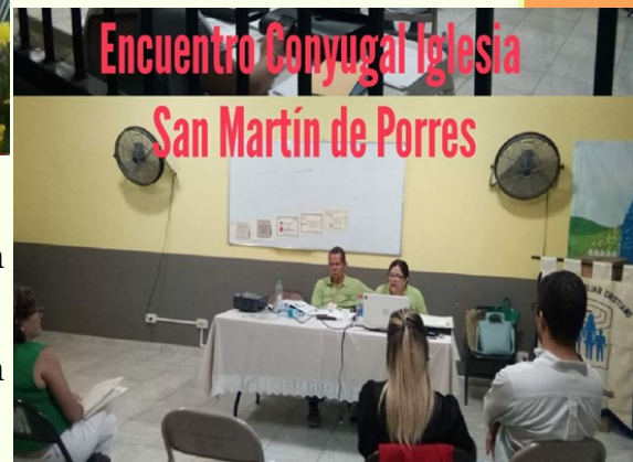
Encuentro Conyugal Iglesia San Martín de Porres